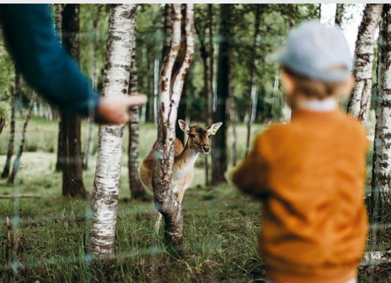
Mores briežu dārzs