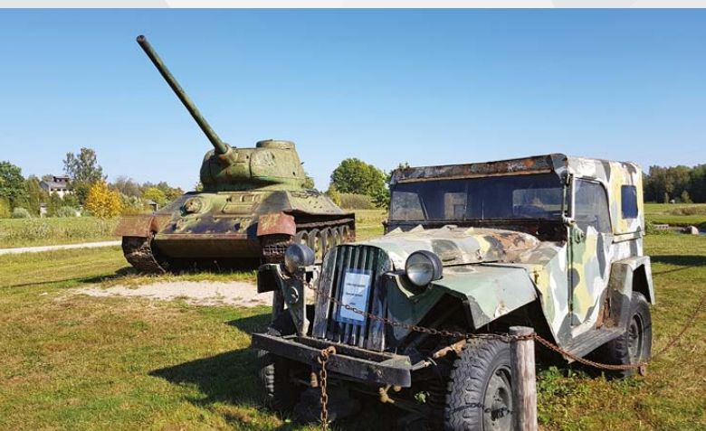
Mores kauju muzejs

Piemiņas zīme uzstādīta Mores pagasta "Peļņos", vietā, kur pulkveža Vācieša komandētā 5. Zemgales pulka strēlnieki 1917. gada 18. septembrī apturēja ķeizarišķās Vācijas 8. armijas daļu uzbrukumu Nītaures virzienā un 2. latviešu strēlnieku brigāde pārgāja pretuzbrukumā, atsviežot vācu karaspēku līdz Mālpilij, līdz ar ko latviešu strēlniekiem I Pasaules karš faktiski bija beidzies.