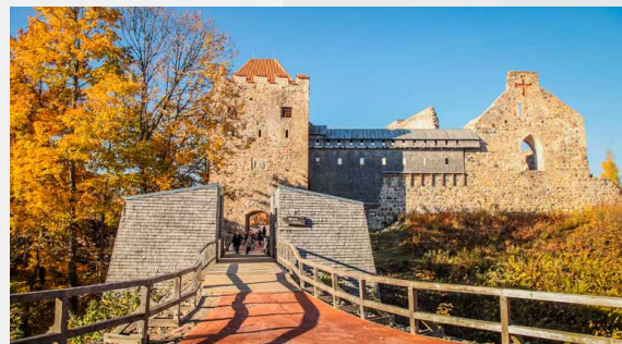
Livonijas ordeņa Siguldas pils