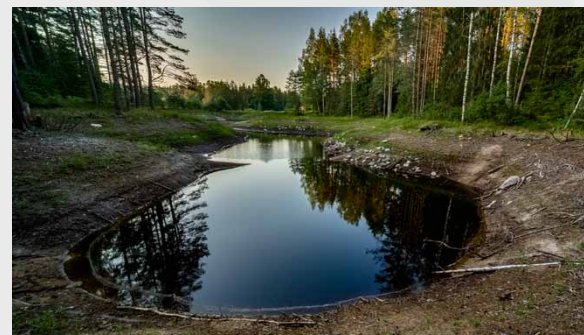
Ezernieku karsta kritene

16 | Lakstīgalas grava 57.15494, 24.84485 Dziļa grava ar mazu strautiņu, kas pāršķeļ Gaujas senlejas kreiso pamatkrastu starp Siguldas Bobsleja un kamanīņu trasi un Siguldas slimnīcu.