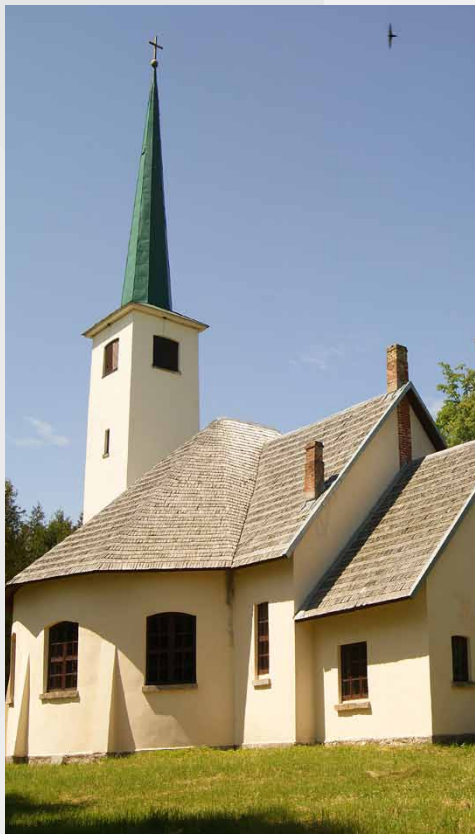
Allažu Evangēliskā luteriskā baznīca