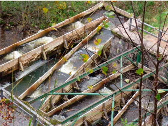
Zivju ceļš Līgatnē