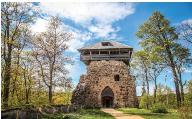
Livonijas ordeņa pils

Livonijas ordeņa Siguldas pils celta 1207. gadā Zobenbrāļu ordeņa mestra Venno laikā kā "castellum" tipa cietoksnis. Mūsdienās apmeklētājiem iespējams uzkāpt pils Ziemeļu tornī un galvenajā Vārtu tornī, kā arī izstaigāt pa pils mūriem. Kopā ar gidu grupa varēs iejusties bruņinieku kārtā – piemērot bruņas, kas veidotas pēc 14./15. gadsimta bruņu parauga.