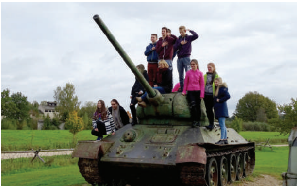
Mores kauju muzejs

Mores kauju muzejā apskatāma labiekārtota militārās tehnikas brīvdabas ekspozīcija ar tās ievērojamāko apskates objektu Padomju armijas tanku T-34. Iekšējai ekspozīcijai veltīta Mores kauju piemiņai un to vēsturiski nozīmīgajiem pavērsieniem II Pasaules kara laikā un I Pasaules kara notikumiem Mores pagastā, kā arī apskatāmi 19.gs. un 20.gs. mājsaimniecības un amatniecības priekšmeti. Šogad apskatāma novadpētniecības izstāde - "Poriešu dzimtas kultūrvēsturiskais mantojums".