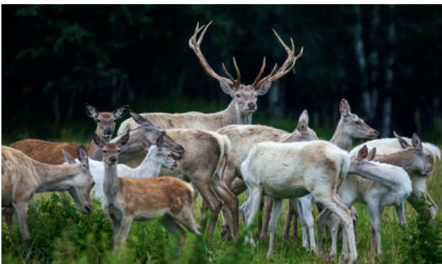
Safari parks "More"

Adrese: Kalna Kaņēni, More, Siguldas novads