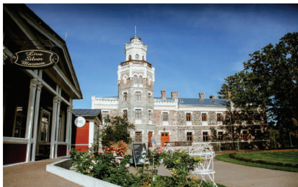
Siguldas Jaunā pils

Jaunums! 1878.gadā kņazu Kropotkinu būvētā Siguldas Jaunā pils no ārpuses saglabājusi tās neogotikas stilu, savukārt iekšpusē 1937.gadā Rakstnieku un žurnālistu pils kļuvusi par nacionālā romantisma pērli. Pils apmeklētājiem ir iespēja uzkāpt pils tornī, lai vērotu krāšņo Gaujas senleju, līdzdarboties interaktīvajā pils ekspozīcijā, kā arī iepazīties ar pils spoku.